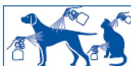
3 Large jet for back and sides, standing