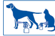
5 Narrow jet for paws and skin folds, standing 6 Put the product on a glove for the face