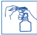
1 Adjust the nozzle

goed vochtig wordt. Wrijf de vacht in, vooral bij langharige dieren, zodat het product tot op de huid komt. Bij behandelen van het kopgebied en bij jonge of nerveuze dieren kan gesprayd worden op een handschoen waarmee het product daarna in de vacht gewreven wordt. Laat het dier drogen aan de lucht. Gebruik geen handdoek om het dier te drogen.