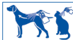
2 Spray against direction of hair growth, holding the animal