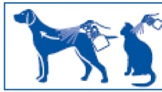
2 Spray against direction of hair growth, holding the animal