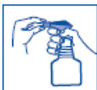
1 Adjust the nozzle

Spray het gehele dier in en houd een afstand aan van ongeveer 10-20 cm. Verdeel het tegen de haren in en zorg dat de hele vacht goed vochtig wordt. Wrijf de vacht in, vooral bij langharige dieren zodat het product tot op de huid komt. Bij behandelen van het kopgebied en bij jonge of nerveuze dieren kan gesprayd worden op een handschoen waarmee het product daarna in de vacht gewreven wordt. Laat het dier drogen aan de lucht. Gebruik geen handdoek om het dier te drogen.