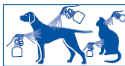
3 Large jet for back and sides, standing