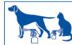
5 Narrow jet for paws and skin folds, standing